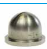
tryska Q-Tip extra široký nástřik