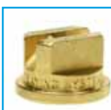
tryska 9501 široký nástřik