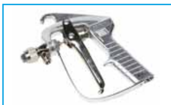
Stříkací pistole s tryskou 6501