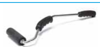
přítlačný váleček s opěrnou plochou 7,5 cm