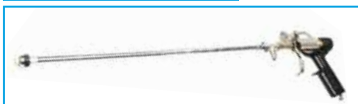
Stříkací pistole prodloužená s tryskou Q-tip pro GEKKO