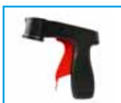
držák na spreje