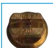
tryska 1501 pro nástřik hran