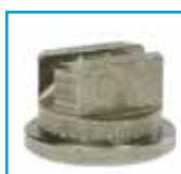
tryska 6501 standard nástřik