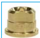
tryska Lechler nástřik CO-REZ