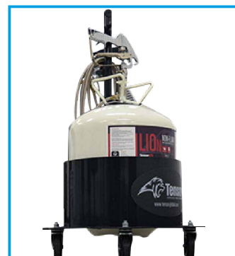
Vozík na kanystry