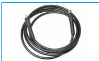
Hadice pro nástřik lepidla 4m černá