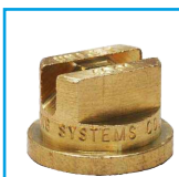
tryska 4001 nástřik mihoviny