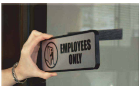
Upevnění plastových značení k okennímu sklu