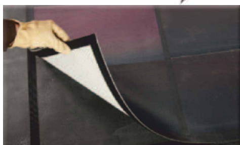
Upevnění flexibilních solárních panelů ke střešní membráně ke zvýšení odolnosti proti větru