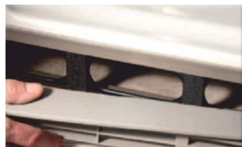
Upevnění plastových vzduchových ventilů k podstavě chladničky k zamezení vibrací